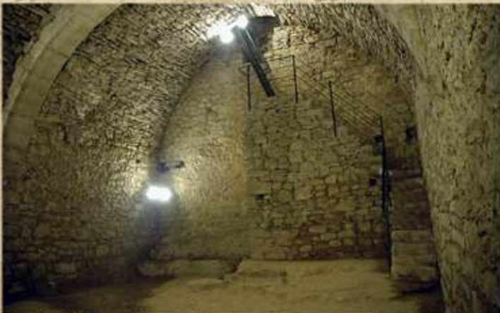
Interior del pou de neu.