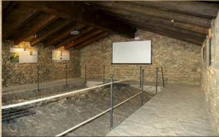
Interior de la casa del nevater on s'ubica l'exposició.